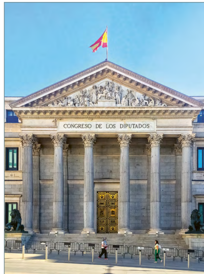
Bald mit eigenem TA-Büro: der Palacio de las Cortes, Sitz des spanischen Parlaments

Das spanische Parlament in Madrid erhält ein Büro für Wissenschaft und Technologie. Eine entsprechende Vereinbarung unterzeichneten im März 2021 die spanische Stiftung für Wissenschaft und Technologie (FECYT), die dem Ministerium für Wissenschaft und Innovation untersteht, und der Congreso de los Diputados, das Unterhaus des spanischen Parlaments. Ziel ist es, Abgeordneten den Zugang zu wissenschaftlichen Erkenntnissen und technologischen Entwicklungen zu erleichtern und sie bei der Entscheidungsfindung zu unterstützen. Dazu soll das Büro künftig unabhängige Berichte zu vom Parlament ausgewählten Themen erstellen. In seiner Verantwortung liegen zudem Aktivitäten, um die wissenschaft-